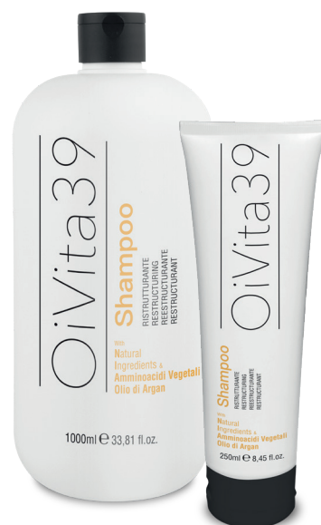
Shampoo Ristrutturante 1000ml – 250ml