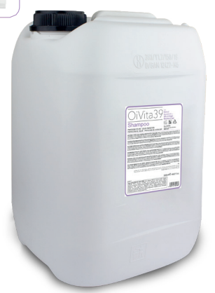
Shampoo Protezione Colore 5000ml