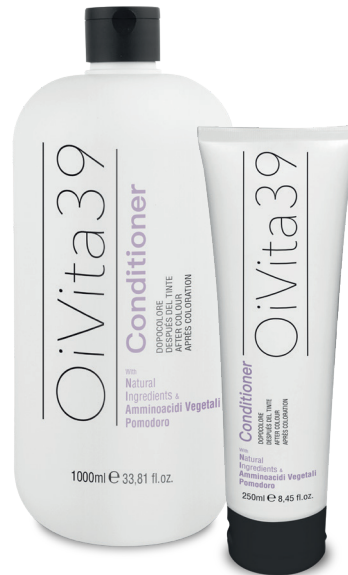
Conditioner Dopocolore 1000ml – 250ml