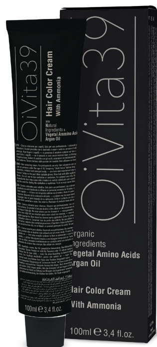
Hair cream color with Ammonia, PPD free