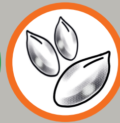
Olio di Argan