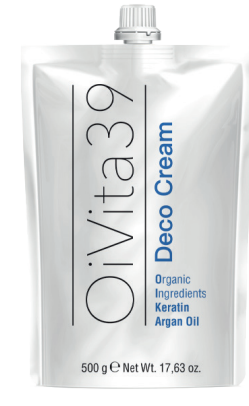
Deco Cream 500g