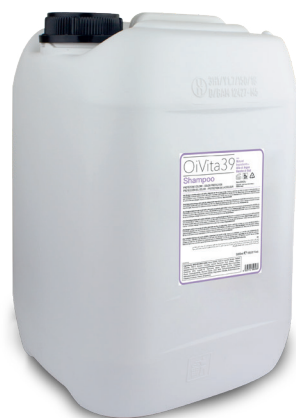
Shampoo Protezione Colore 5000ml