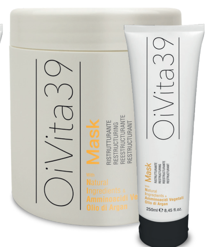
Mask Ristrutturante 1000ml – 250ml