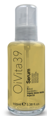
Serum Ristrutturante 100ml