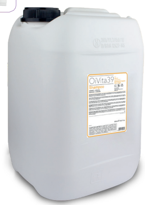
Shampoo Idratante 5000ml