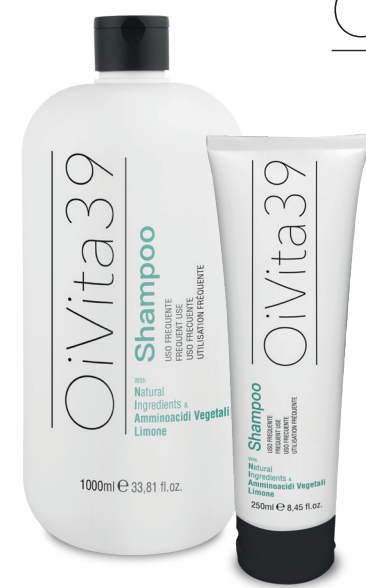
Shampoo Uso Frequente 1000ml – 250ml