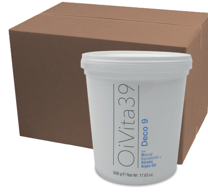
Deco 9 40x500g – 500g