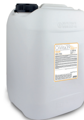
Mask Idratante 5000ml