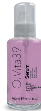
Serum Dopocolore 100ml