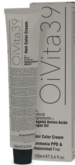
Hair cream color Ammonia, PPD & Resorcinol free 100ml