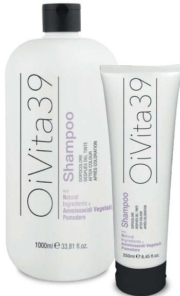
Shampoo Dopocolore 1000ml – 250ml