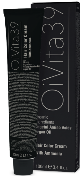
Hair cream color with Ammonia, PPD free 100ml