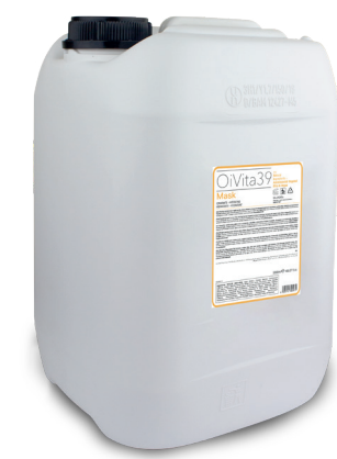
Mask Idratante 5000ml