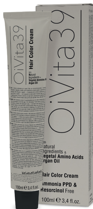
Hair cream color Ammonia, PPD & Resorcinol free