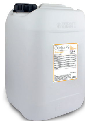
Shampoo Idratante 5000ml