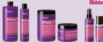
Super No Yellow