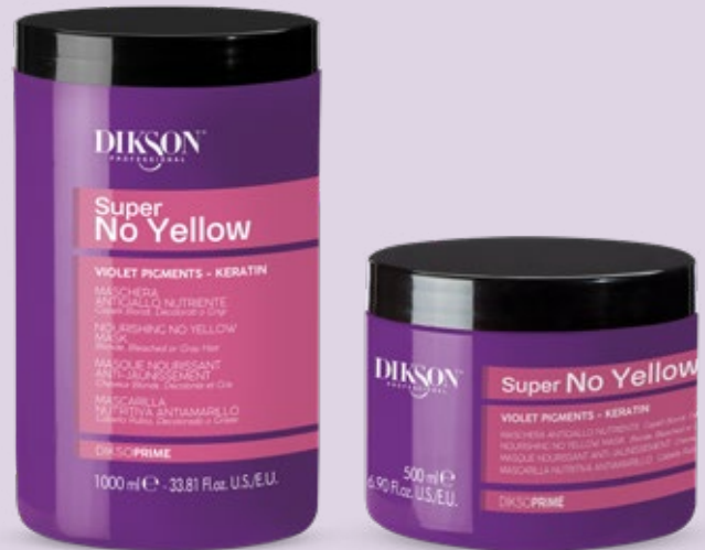
MASCHERA ANTIGIALLO NUTRIENTE 1000 ml Cod. 24004073