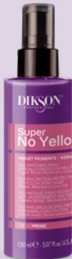
10+1 MASCHERA SPRAY ANTIGIALLO PROTETTIVA MULTIAZIONE 150 ml Cod. 24004075

SENZA RISCIAQUO LEAVE-IN SANS RINÇAGE SIN ENJUAGUE