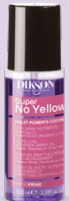
OLIO SPRAY NUTRIENTE ANTIGIALLO 100 ml