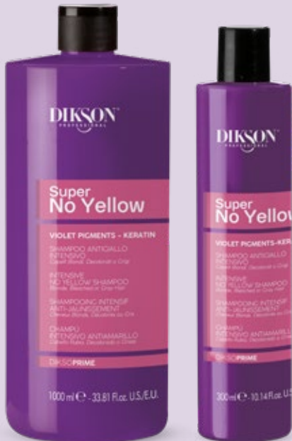
SHAMPOO ANTIGIALLO INTENSIVO 1000 ml Cod. 24004071