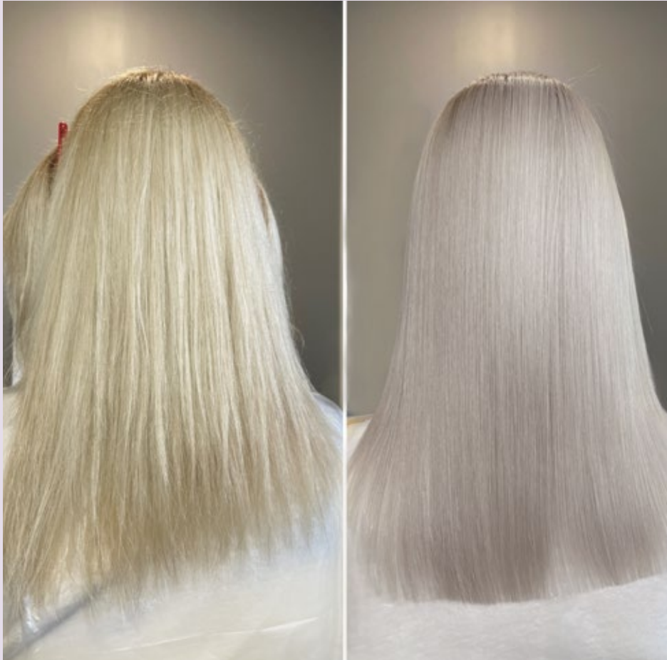
Immagine rappresentativa - Representative image - Image représentative - Imagen representativa