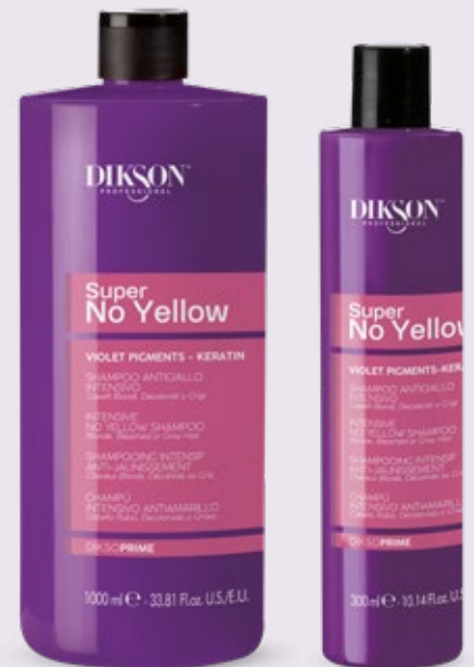
SHAMPOO ANTIGIALLO INTENSIVO 1000 ml