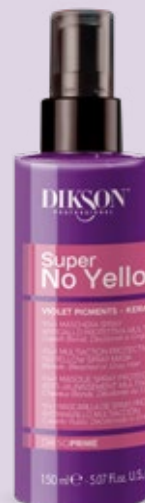
10+1 MASCHERA SPRAY ANTIGIALLO PROTETTIVA MULTIAZIONE 150 ml