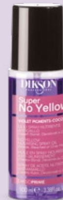
OLIO SPRAY NUTRIENTE ANTIGIALLO 100 ml Cod. 24004074

10+1 Maschera spray antigiallo protettiva multiazione per capelli Biondi, Decolorati o Grigi. Con Pigmenti Viola, Cheratina, Filtri UV e Proteine di Riso. 1 Idrata 2 Nutre 3 Districa 4 Ammorbidisce 5 Rivitalizza 6 Illumina 7 Anticrespo 8 Antiumidità 9 Velocizza la piega 10 Termoprotettiva 11 Antigiallo.