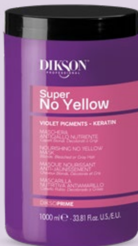
MASCHERA ANTIGIALLO NUTRIENTE 1000 ml