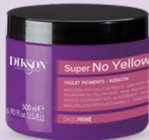
MASCHERA ANTIGIALLO NUTRIENTE 500 ml